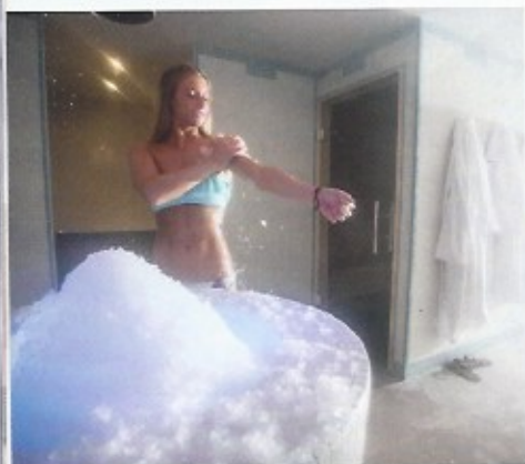
Fontaine de glace

Dr. L.C.: Once the weaning process is complete, the patient enters a stabilisation phase and can reintroduce "treats" even if they can't buy them. They must avoid flavour enhancers (such as glutamate) in widely consumed products and aspartame and stay in "healthy" mode. In my book, I widen the spectrum to include the choice of bedding (be wary of mattresses which are treated and contain nanoparticles, choose a latex mattress which doesn't attract mites, etc.) and how food is cooked (be careful with frying pan coatings, etc.).